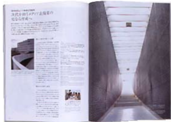
岐阜県立国際情報芸術アカデミー