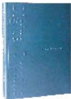
Digital Dreams 日本語版

AXISでは雑誌のほかに書籍として、先端企業のデザインの全貌を紹介するコーポレートシリーズをはじめ、作家やデザイン全般に対する書籍の企画出版を行っています。