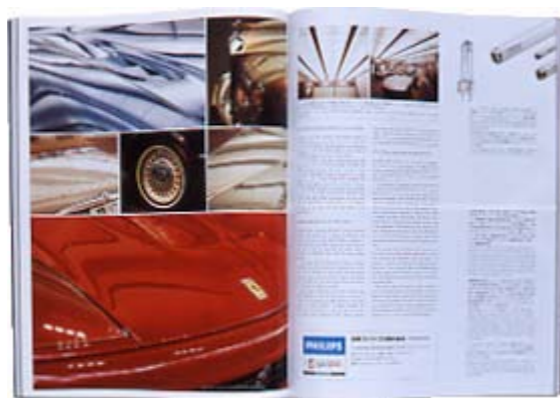
日本フィリップス株式会社