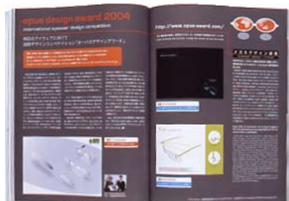
オーバスデザインアワード